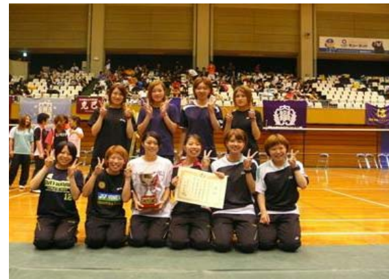
女子団体 準優勝 東海学院大学