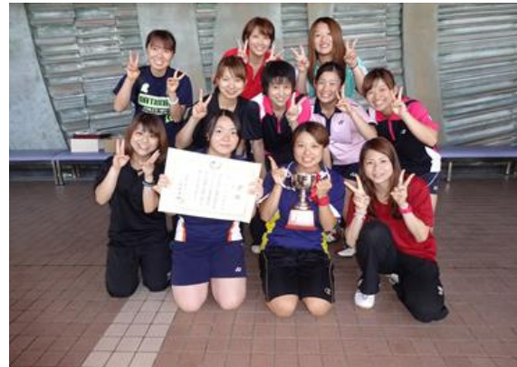
女子団体 3 位 立命館大学