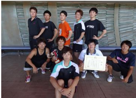
男子団体 3 位 同志社大学