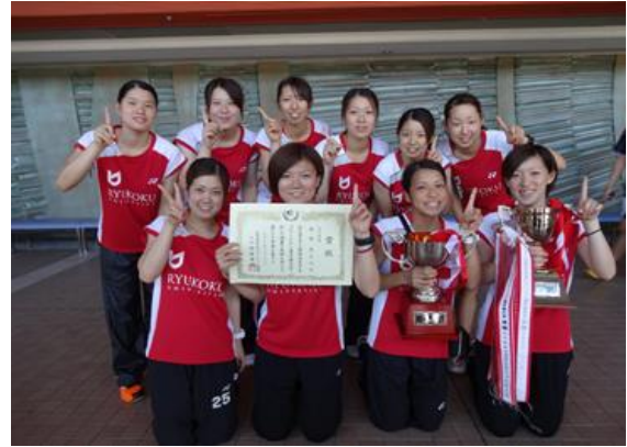
女子団体 優勝 龍谷大学