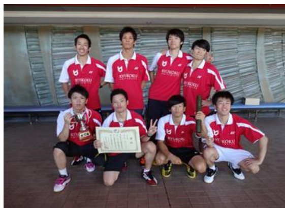
男子団体 3 位 龍谷大学