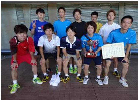
男子団体 準優勝 金沢学院大学