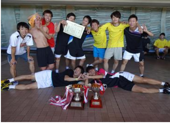
男子団体 優勝 近畿大学