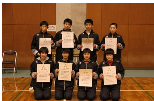
準優勝:熊本県選抜