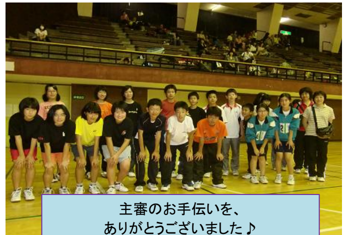
主審のお手伝いを、 ありがとうございました♪