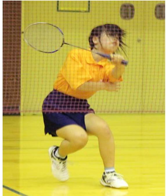
入賞された選手のみなさん