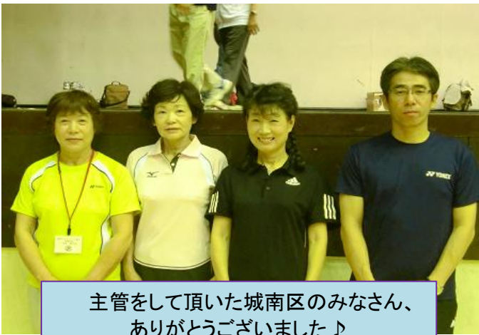
主管をして頂いた城南区のみなさん、 ありがとうございました♪