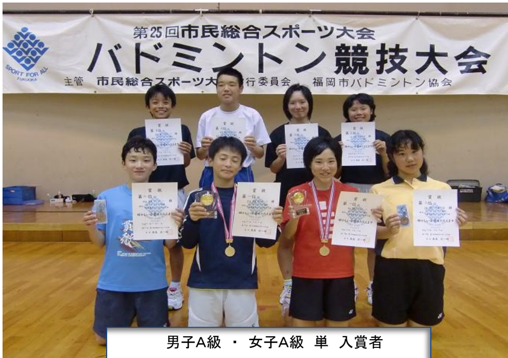
男子A級・女子A級 単 入賞者