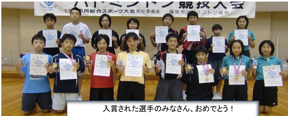
入賞された選手のみなさん、おめでとう！