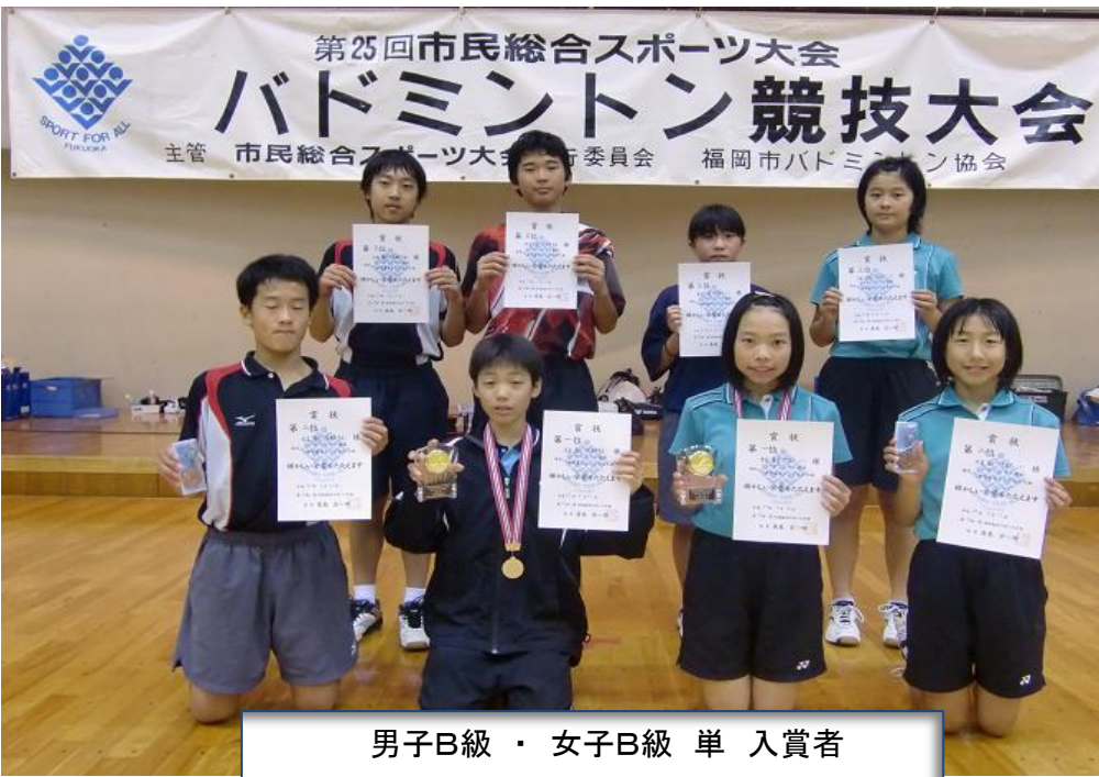
男子B級・女子B級 単 入賞者