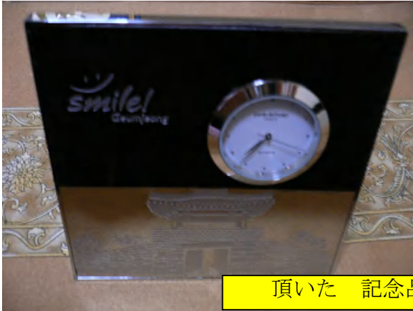
頂いた 記念品・賞品