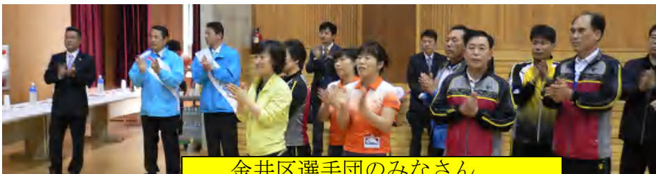
金井区選手団のみなさん