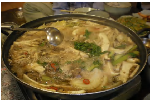
3日間 美味しいお料理ばかりを 頂きました♪

釜山広域市金井区連合会の皆さん、 観光・交歓会・歓迎パーティー等 大変お世話になりました。