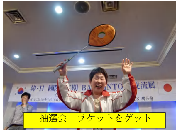
抽選会 ラケットをゲット