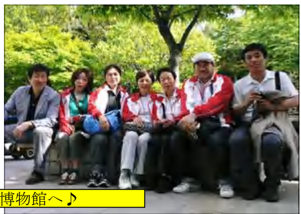
昼食後 観光 博物館へ♪