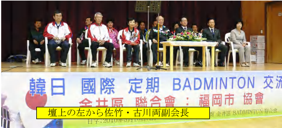
壇上の左から佐竹・古川両副会長