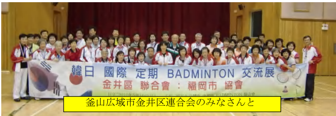
釜山広域市金井区連合会のみなさんと