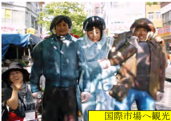
国際市場へ観光・食事へ