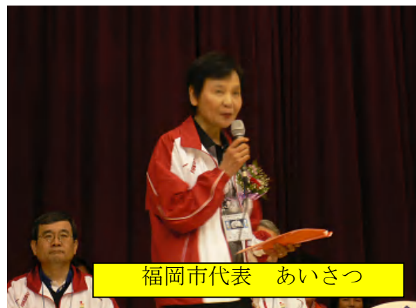
福岡市代表 あいさつ