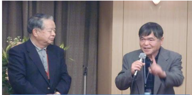
秋山副会長 荒川副理事長 学生時代対戦をして数十年ぶりの再会です♪