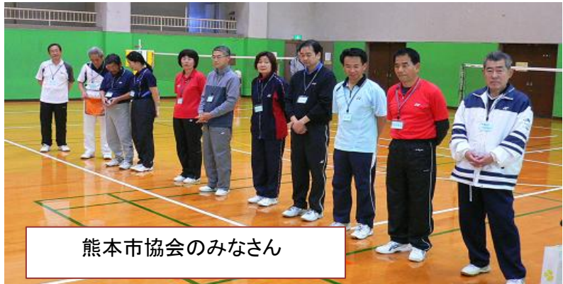
熊本市協会のみなさん