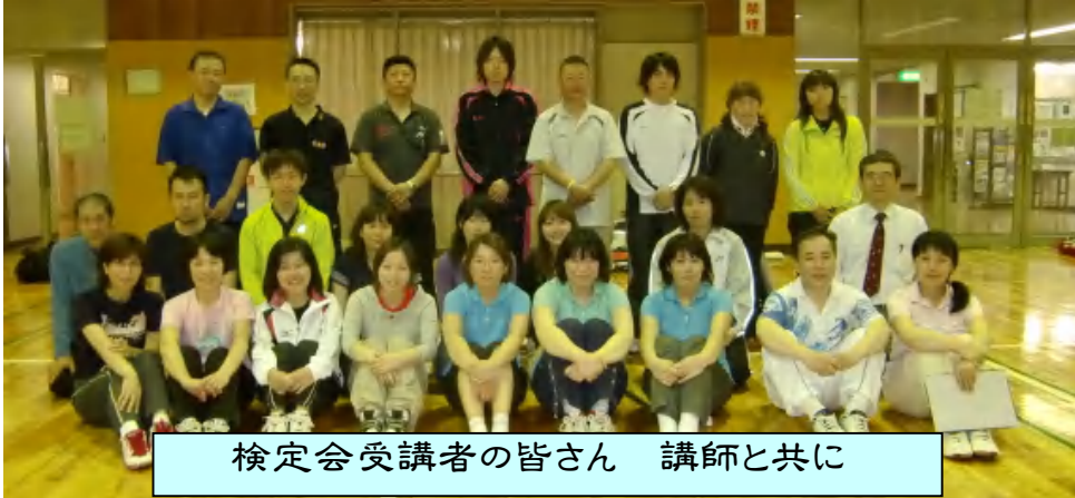
検定会受講者の皆さん 講師と共に