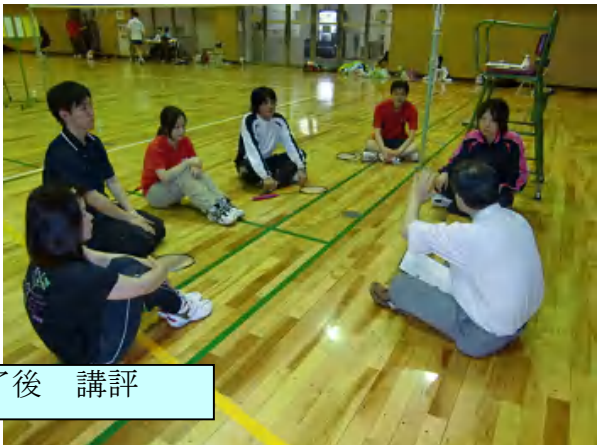
検定会終了後 講評